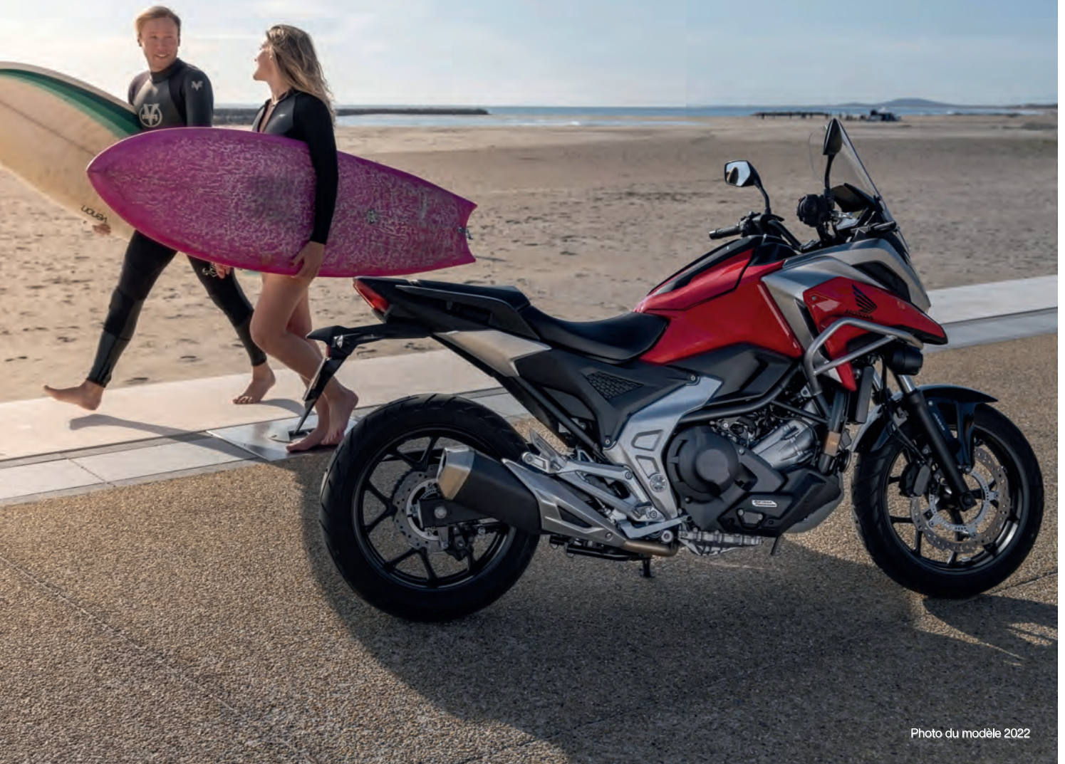
Photo du modèle 2022